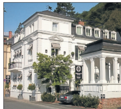
Klein, aber fein – und strahlend weiß: die „Heidelberg Suites“.

Einige Räume haben Balkone. Von dort kann man über den Neckar zum Schloss, zur Alten Brücke und auf die Altstadt sehen.