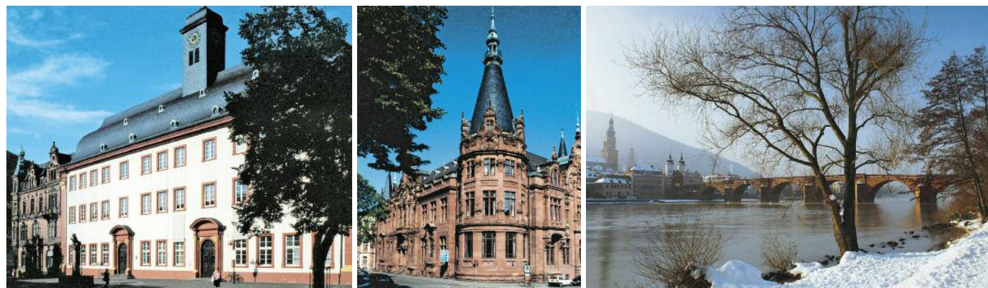
Links: Die Universitätsgebäude bestimmen das Stadtbild Heidelbergs. Die „Alte Uni“ liegt mitten im Zentrum. Mitte: In der prachtvollen Unibibliothek befinden sich zahlreiche wertvolle alte Handschriften. Rechts: Blick vom verschneiten Neckarufer auf die „Alte Brücke“.

Shopping-Tipps: Holgersons, Sofienstraße 19, www.holgersons.de (Wohnaccessoires, siehe Bilder oben); Jackpot, Hauptstraße 106 (Bekleidung); Knösel Heidelberger Studentenkuss, Haspelgasse 16 (Schokolade) Hotel: Heidelberg Suites, Neuenheimer Landstraße 12, Tel. 0 62 21-6 55 65-0, www.heidelbergSuites.com Essen: Cafés und Restaurants gibt es z. B. in der Steingasse; Das Lamm Heidelberg, Pfarrgasse 3, www.lamm-heidelberg.de