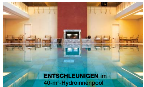
ENTSCHLEUNIGEN im 40-m 2 -Hydroinnenpool

Zusätzlich zu dem neuen Spabereich wurde durch einen neuen Trakt die Zahl der Suiten und Zimmer um 27 auf 66 aufgestockt. Auch hinter dem Herd tut sich was: Mitte April zieht der 2-Sterne-Koch Boris Benecke ins Schloss. EZ ab 210 €. www.schlosshotel-friedrichsruhe.de CS